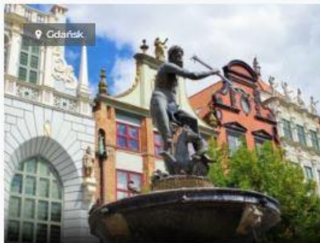
WYCIECZKA PO GDAŃSKU