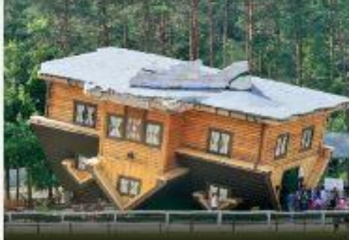
WYCIECZKA NA KASZUBY