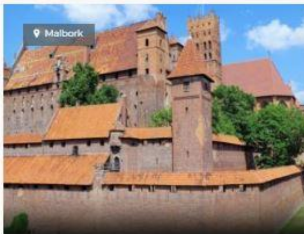
WYCIECZKA DO MALBORKA