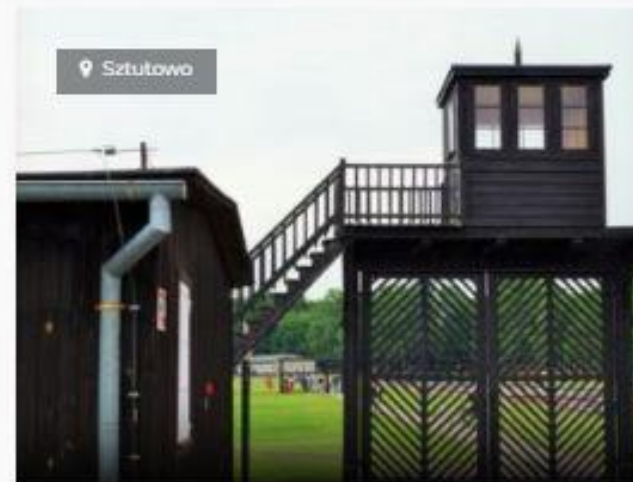
WYCIECZKA DO STUTTHOF