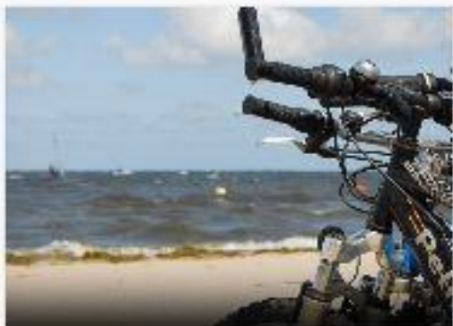
WYCIECZKA ROWEROWA Z GDAŃSKA DO SOPOTU