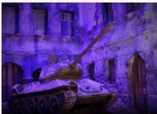
MUZEUM II WOJNY ŚWIATOWEJ