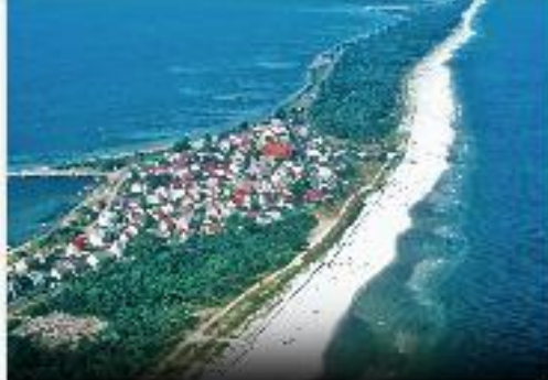
WYCIECZKA SIATKIEM NA HEL