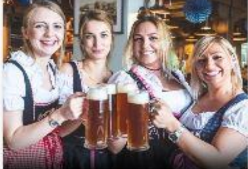
WYCIECZKA PO BRÓWARACH RZEMIEŚLNICZYCH W GDAŃSKU