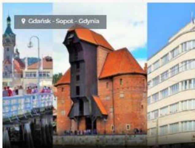
GDAŃSK – SOPOT – GDYNIA