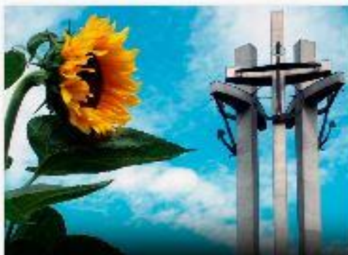
ECS I STOCZNIA GDAŃSKA